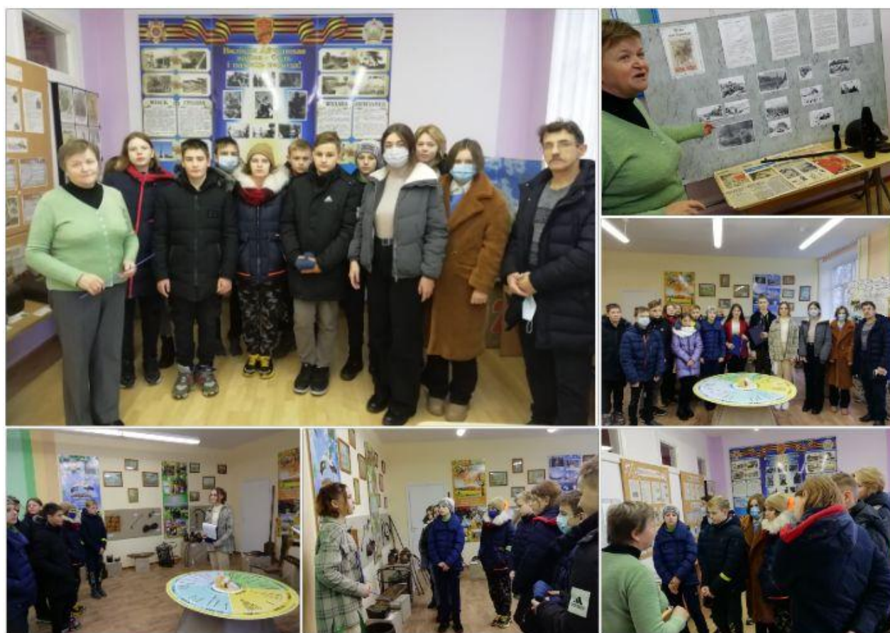
В музее школы

1.1. Посетили музейную комнату "Памяць", музей "Кола часу" государственного учреждения образования "Учебно-педагогический комплекс Вензовецкий детский сад-средняя школа". В результате посещения музея и музейной комнаты, учащиеся познакомились с героическим прошлым Дятловщины, посетили экспозицию 80 лет обороны Москвы.